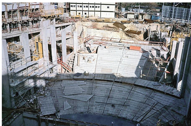
Grand Écran en construction.