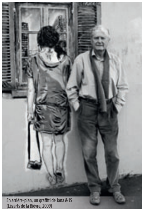
En arrière-plan, un graffiti de Jana & JS (Lézards de la Bièvre, 2009)