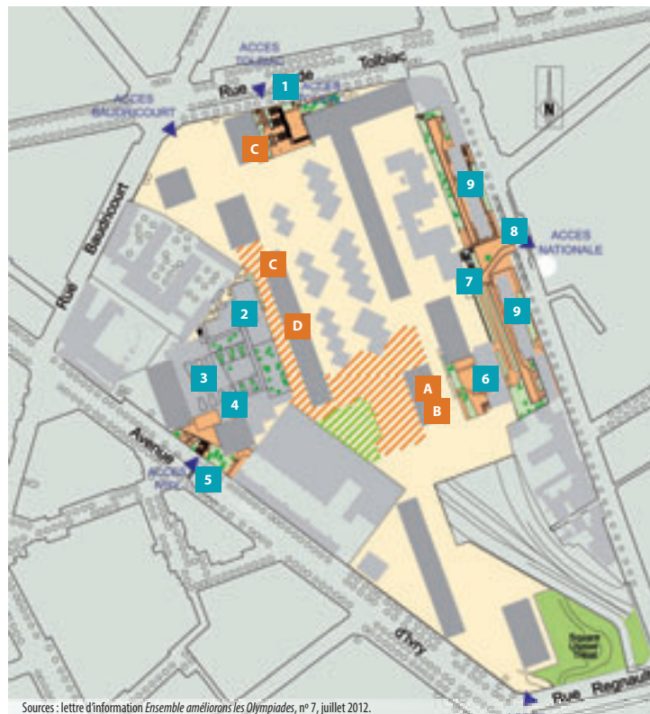
Sources : lettre d'information Ensemble améliorons les Olympiades, n° 7, juillet 2012.

Il n'empêche que les Olympiades ne sont toujours pas un quartier comme les autres. Dix ans après l'inauguration, les