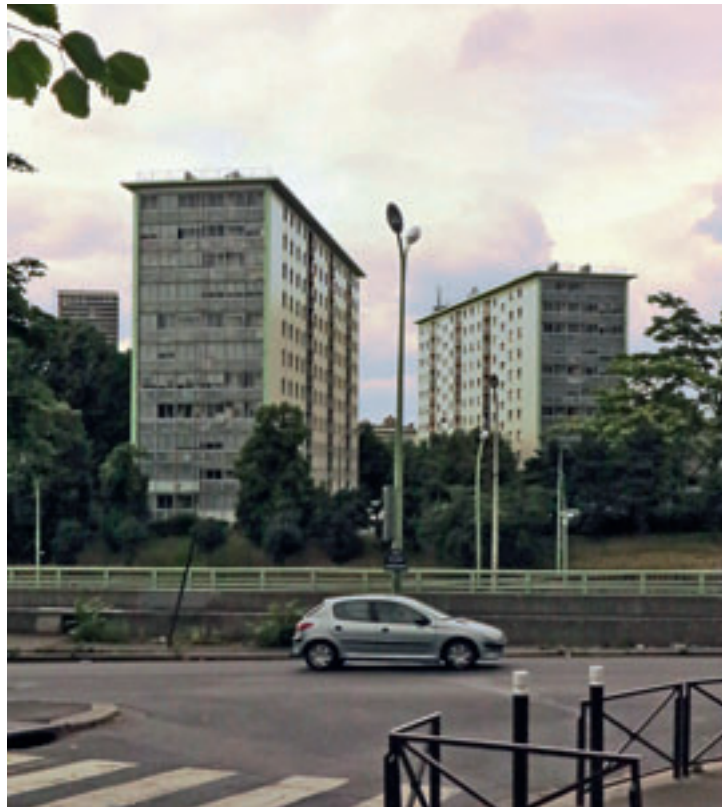
Zac Paul-Bourget, état actuel du site

Cette note s'appuie sur l'analyse du dossier d'enquête publique et propose de réfléchir un moment sur les enjeux d'un projet d'exception qu'on peut qualifier de « projet de démolition/construction avec opération-tiroir ».