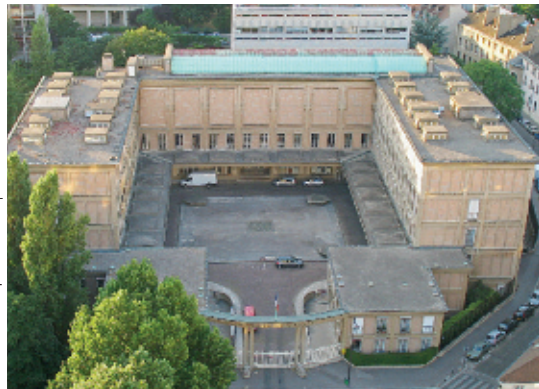
Le Mobilier national depuis la Tour Albert

Le Mobilier national est un bâtiment emblématique du 13 e arrondissement construit en béton en 1934, sur les anciens jardins de la Manufacture des Gobelins. Il synthétise une série d'expériences menées autour du thème de la « trame » et du « monument » qui fait que la structure du bâtiment coïncide avec son apparence. C'est un superbe édifice, classique par son plan et rationaliste par sa structure apparente. Il compte parmi les édifices majeurs réalisés par l'architecte Auguste Perret (1874-1954) qui viennent d'être présentés à l'exposition « Auguste Perret, huit chefs-d'œuvre !? - Architectures en béton armé » dans la superbe salle hypostyle du Palais d'Éléna, qui est l'un d'eux. Les autres monuments étaient l'immeuble de la rue Franklin, 1903, le théâtre des Champs-Élysées, 1913, l'église du Raincy,