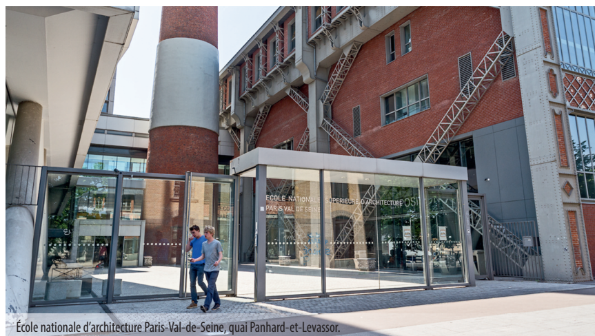
École nationale d'architecture Paris-Val-de-Seine, quai Panhard-et-Levassor.