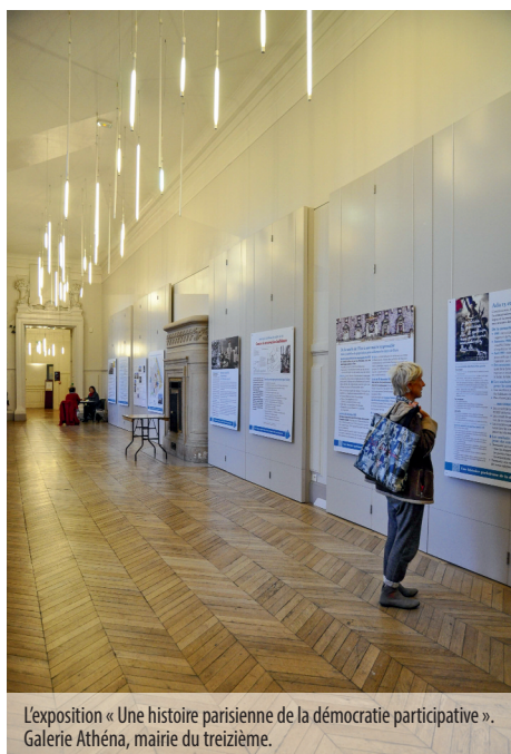
L'exposition « Une histoire parisienne de la démocratie participative ». Galerie Athéna, mairie du treizième.