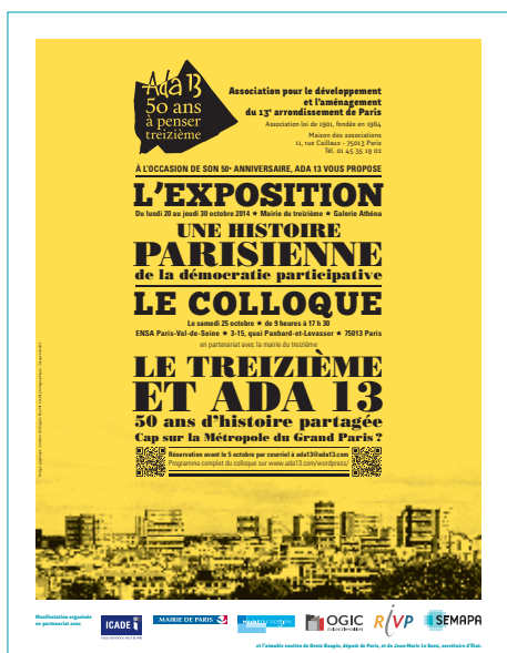
L'affiche annonçant les manifestations du 50 e anniversaire d'Ada 13.