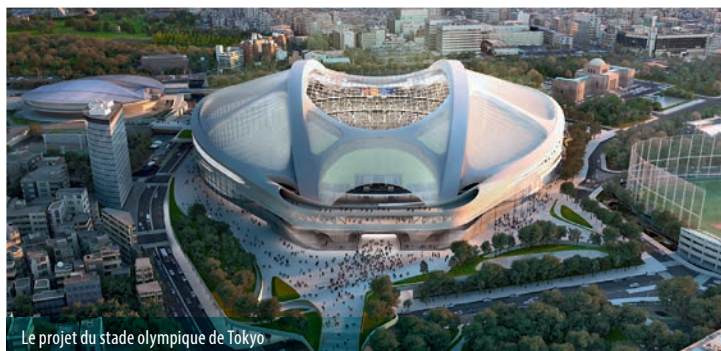
Le projet du stade olympique de Tokyo

Lorsque l'architecte irako-britannique Zaha Hadid remporta le concours international du stade olympique des JO de Tokyo de 2020, rien ne présageait que les choses prendraient une telle tournure. Alors que son projet semblait être celui qui répondait le mieux au cahier des charges du CIO, il a subi dès 2012 de vives critiques au sujet de son esthétique et de son coût. Ce mouvement d'opinion ayant pris de plus en plus d'ampleur, le premier ministre Shinzo Abe a ordonné le 17 juillet 2015 l'abandon du projet et il a lancé un nouvel appel d'offres.