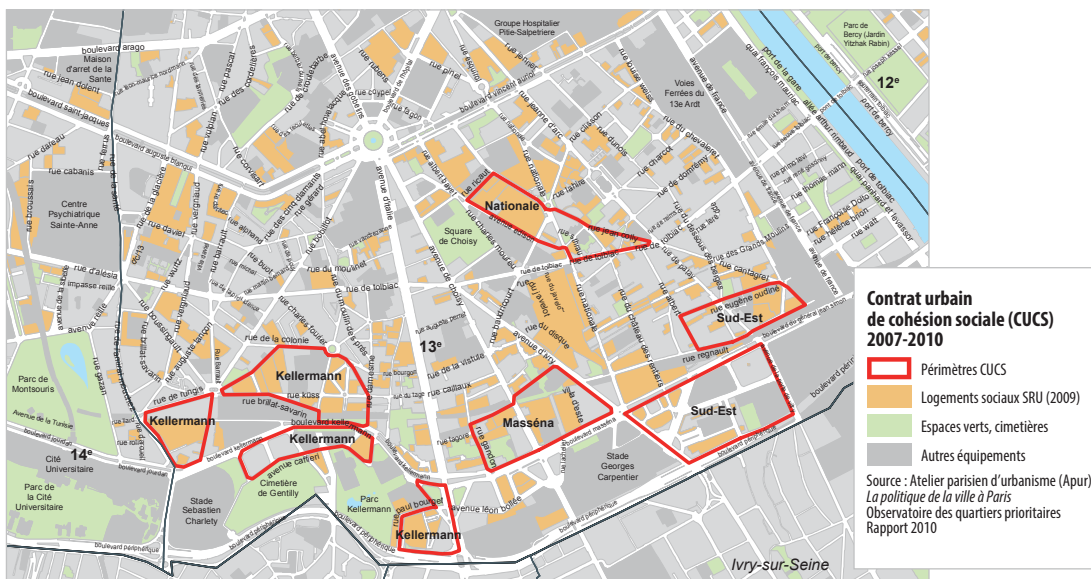
Contrat urbain de cohésion sociale (CUCS) 2007-2010 ■ Périmètres CUCS ■ Logements sociaux SRU (2009) ■ Espaces verts, cimetières ■ Autres équipements Source : Atelier parisien d'urbanisme (Apur) La politique de la ville à Paris Observatoire des quartiers prioritaires Rapport 2010