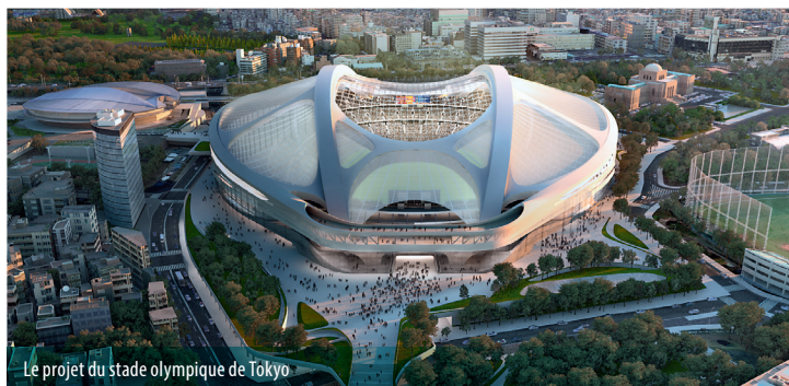
Le projet du stade olympique de Tokyo

Lorsque l'architecte irako-britannique Zaha Hadid remporta le concours international du stade olympique des JO de Tokyo de 2020, rien ne présageait que les choses prendraient une telle tournure. Alors que son projet semblait être celui qui répondait le mieux au cahier des charges du CIO, il a subi dès 2012 de vives critiques au sujet de son esthétique et de son coût. Ce mouvement d'opinion ayant pris de plus en plus d'ampleur, le premier ministre Shinzo Abe a ordonné le 17 juillet 2015 l'abandon du projet et il a lancé un nouvel appel d'offres.