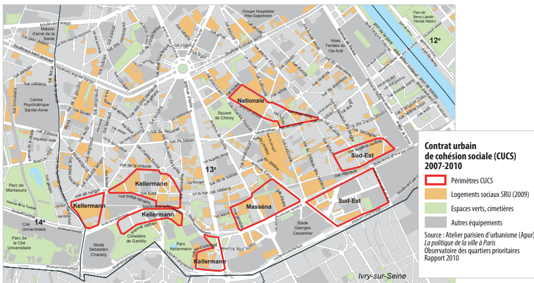
Contrat urbain de cohésion sociale (CUCS) 2007-2010