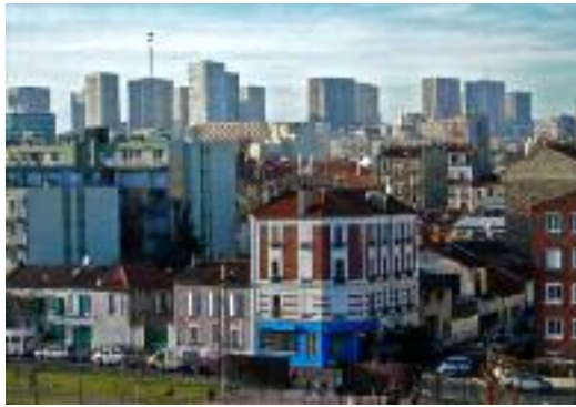
Les tours du 13 e vues d'Ivry.

d'accord également mais à condition d'avoir des données plus précises sur un véritable projet d'urbanisme.